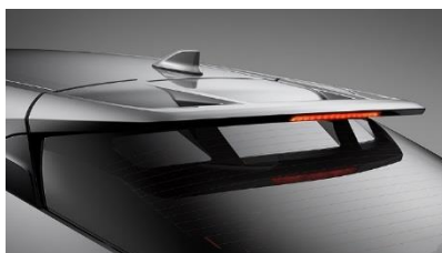
L'antenne de toit requin est présente sur toutes nos finitions.