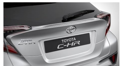
Disponible en 2 motorisations : essence 1,2L turbo (boîte manuelle - boîte automatique) et hybride 1,8L (boîte automatique).