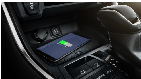
Le Nouveau RAV4 est équipé d'un chargeur de smartphone à induction.

Nos forfaits entretien 4x4 et hybrides sont très compétitifs : n'hésitez pas à vous renseigner.